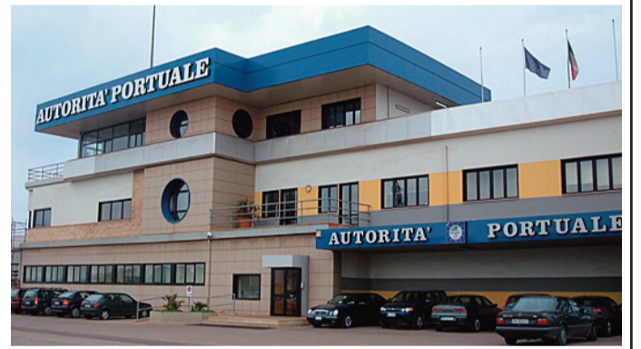
La sede dell'Autorità portuale dove è stato firmato l'accordo