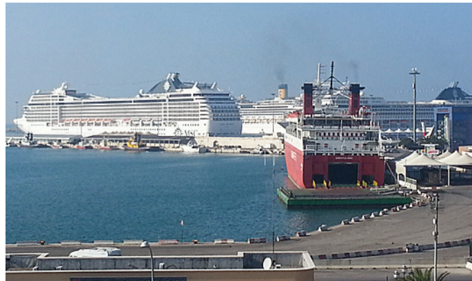
Sullo sfondo le tre navi da crociera nel porto di Bari